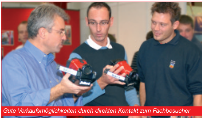
Gute Verkaufsmöglichkeiten durch direkten Kontakt zum Fachbesucher