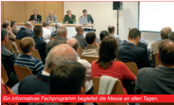
Ein informatives Fachprogramm begleitet die Messe an allen Tagen.