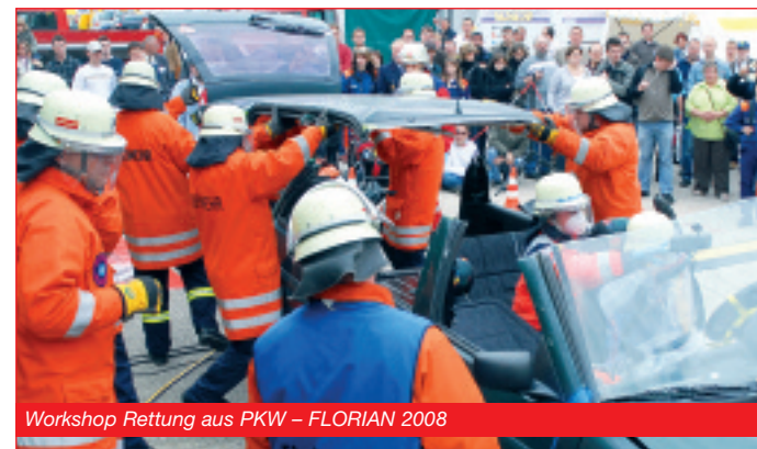
Workshop Rettung aus PKW – FLORIAN 2008

1997 fand die erste FLORIAN in Dresden statt. Anschließend wurde das Veranstaltungskonzept erfolgreich in Erfurt, Cottbus, Halle (Saale) und Sinsheim durchgeführt. Die nunmehr zehnte FLORIAN findet 2009 in der baden-württembergischen Messestadt Karlsruhe statt. Mit dem kontinuierlichen Standortwechsel garantiert die FLORIAN ihren Ausstellern eine systematische Erschließung der verschiedenen Regionen und jeweils kurze Anfahrtswege für ihre Besucher. 2004 wurde erstmalig das Thema Rettungsdienst und Notfallmedizin mit dem Titel aescutec® separat beworben. Die Fachkompetenz erreicht der Veranstalter durch die gute Zusammenarbeit mit den entsprechenden Landesverbänden und einem fachlichen Beirat.